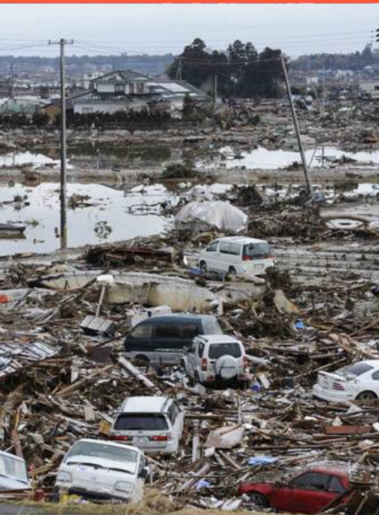
Le 11 Mars 2011