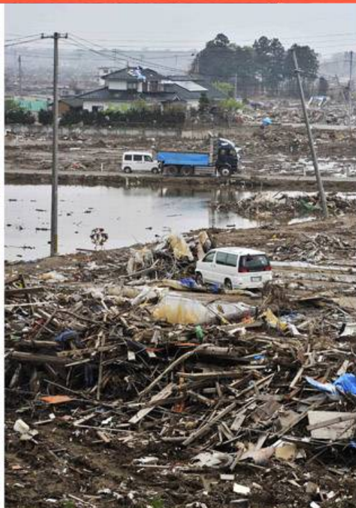
Le 2 Juin 2011