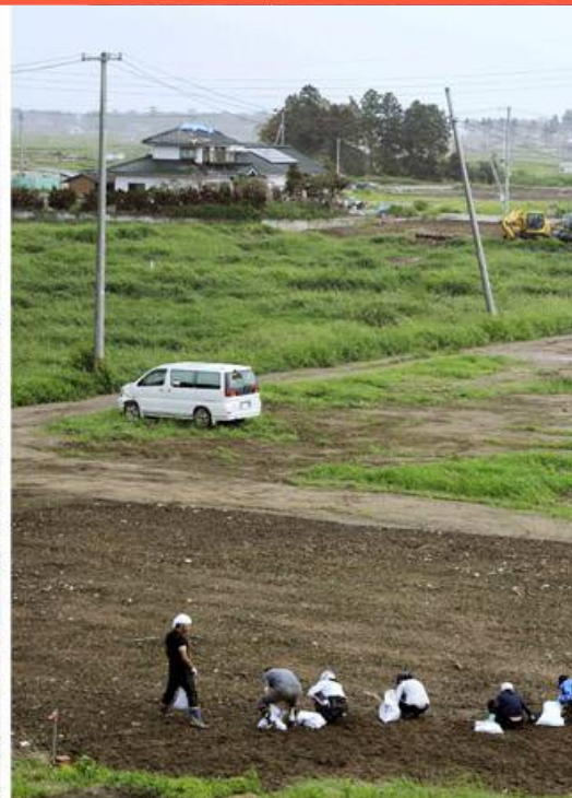
Le 3 Septembre 2011

A force de ne parler dans la presse que de Fukushima, on a tendance à oublier que : LE TSUNAMI, c'est 15,741 morts et 4,467 personnes disparues selon le rapport de la police. 8,650 personnes dans des centres précaires et 40.355 personnes logées temporairement. Plus de 48,600 maisons préfabriquées construites fin Août sur 52.348 planifiées. 82,000 familles déplacées approvisionnées en kits d'appareils ménagers. Objectif croix rouge japonaise : fournir 110.000 familles en kits. Fin Août, la croix rouge japonaise avait collecté plus de 2,5 milliards d'euros. Sans chercher à occulter l'accident nucléaire, l'ARSCA estime important de rendre hommage à toute une population, aux énormes efforts déployés et de ne pas oublier la détresse de milliers de familles dont beaucoup ont tout perdu.